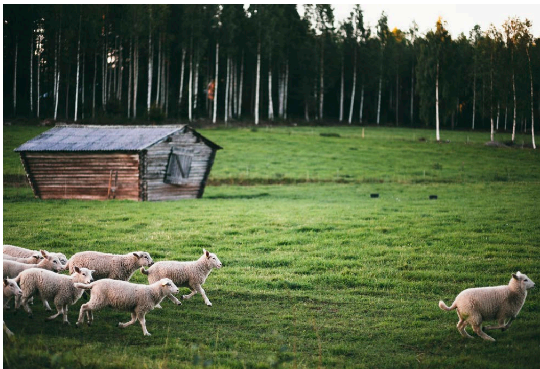
Får på bete i Bondersbyn.

✓ Genomförare: främjar- och rådgivningsorganisationer, utbildningsaktörer, Länsstyrelsen, kommuner.