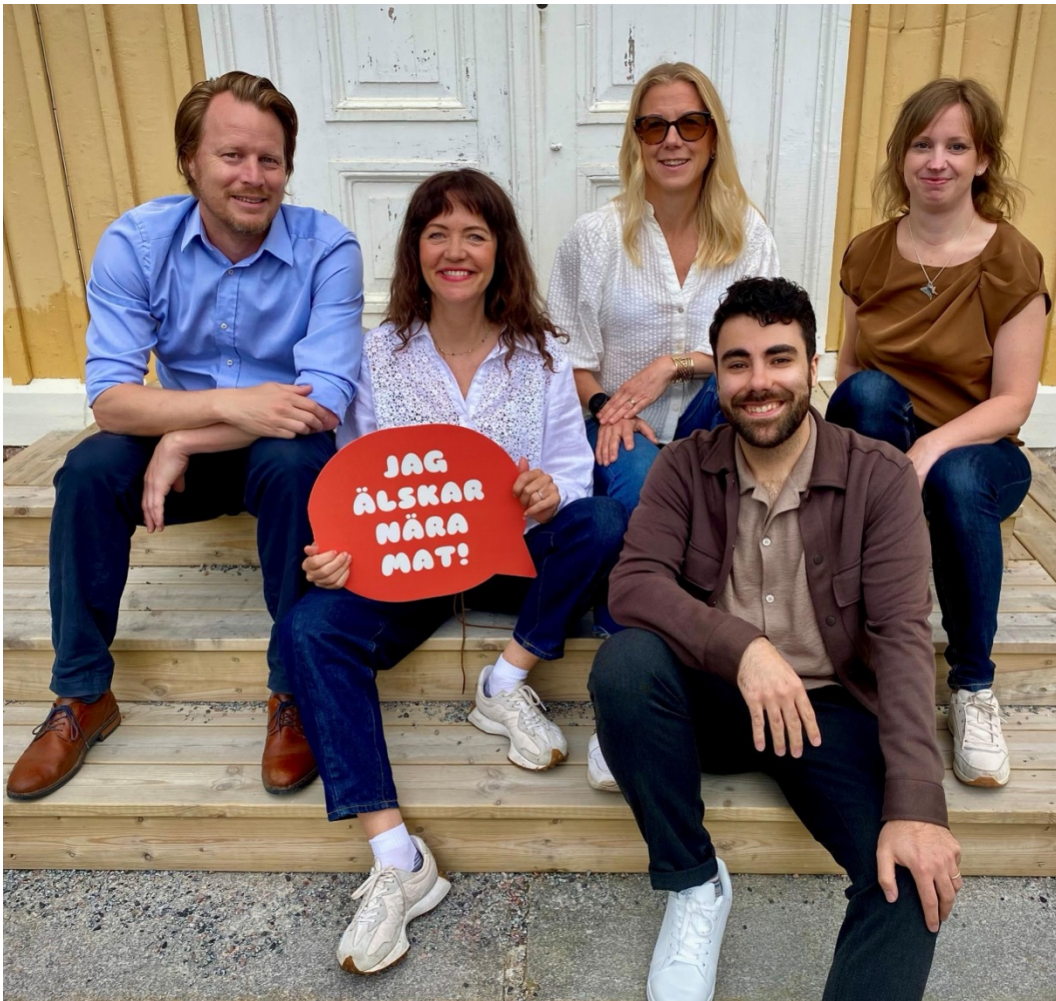
Offentliga aktörer i samarbete för ett stärkt genomförande av Norrbottens livsmedelsstrategi, Nära Mat.