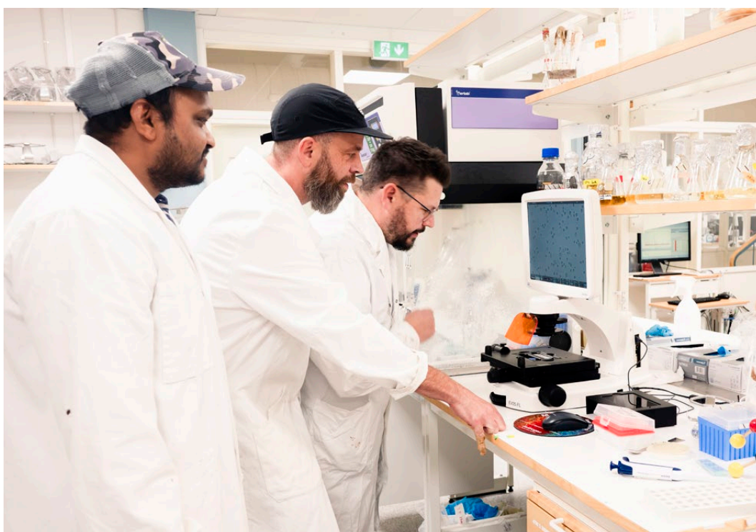
Utveckling och analys, Bottenvikens bryggeri.

✓ Genomförare: Regionen, Länsstyrelsen, kommuner.