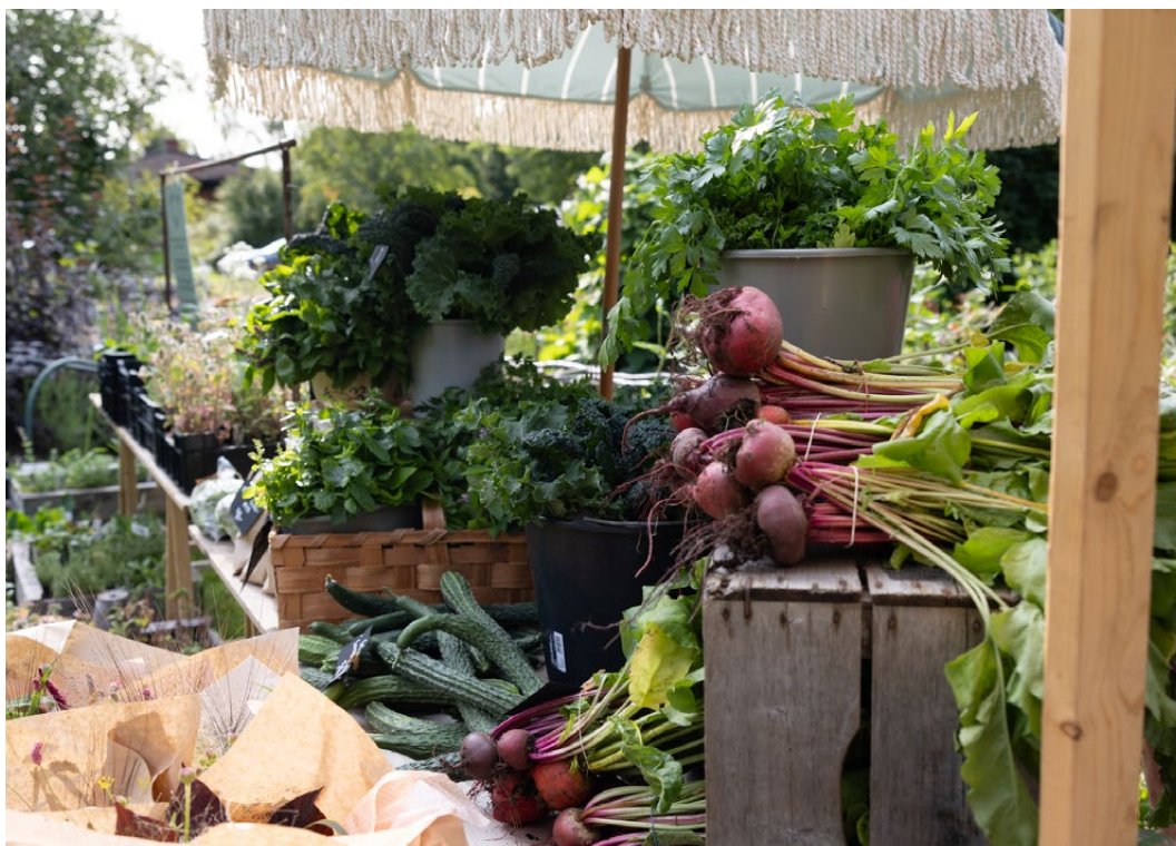
Skördemarknad vid Skogsbynets trädgård.

Målet är att andelen norrbottnisk mat ska öka i butik, på restauranger, vid event och i offentliga kök. Den regionala maten ska vara lätt att hitta. Mat och produkter ska utvecklas kreativt och serveras med stolthet.