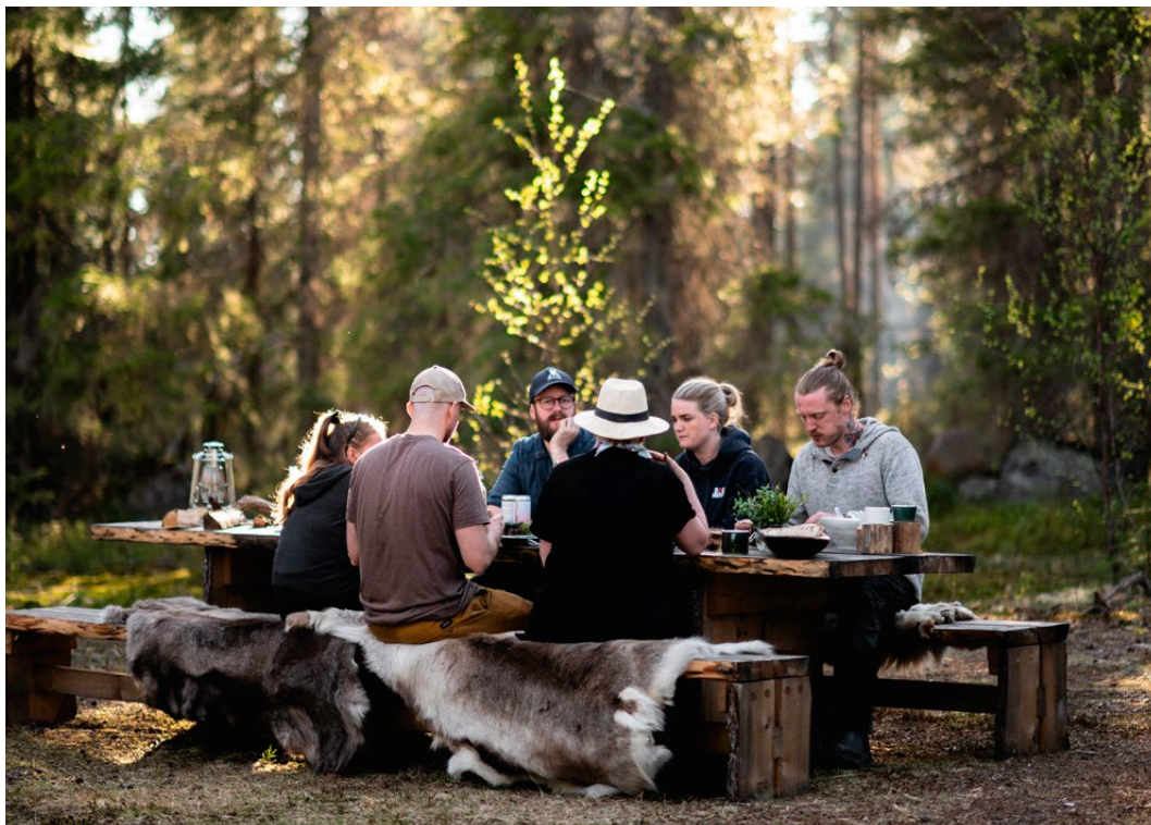
Lunch hos Huuva Hideaway i Liehittäjä.