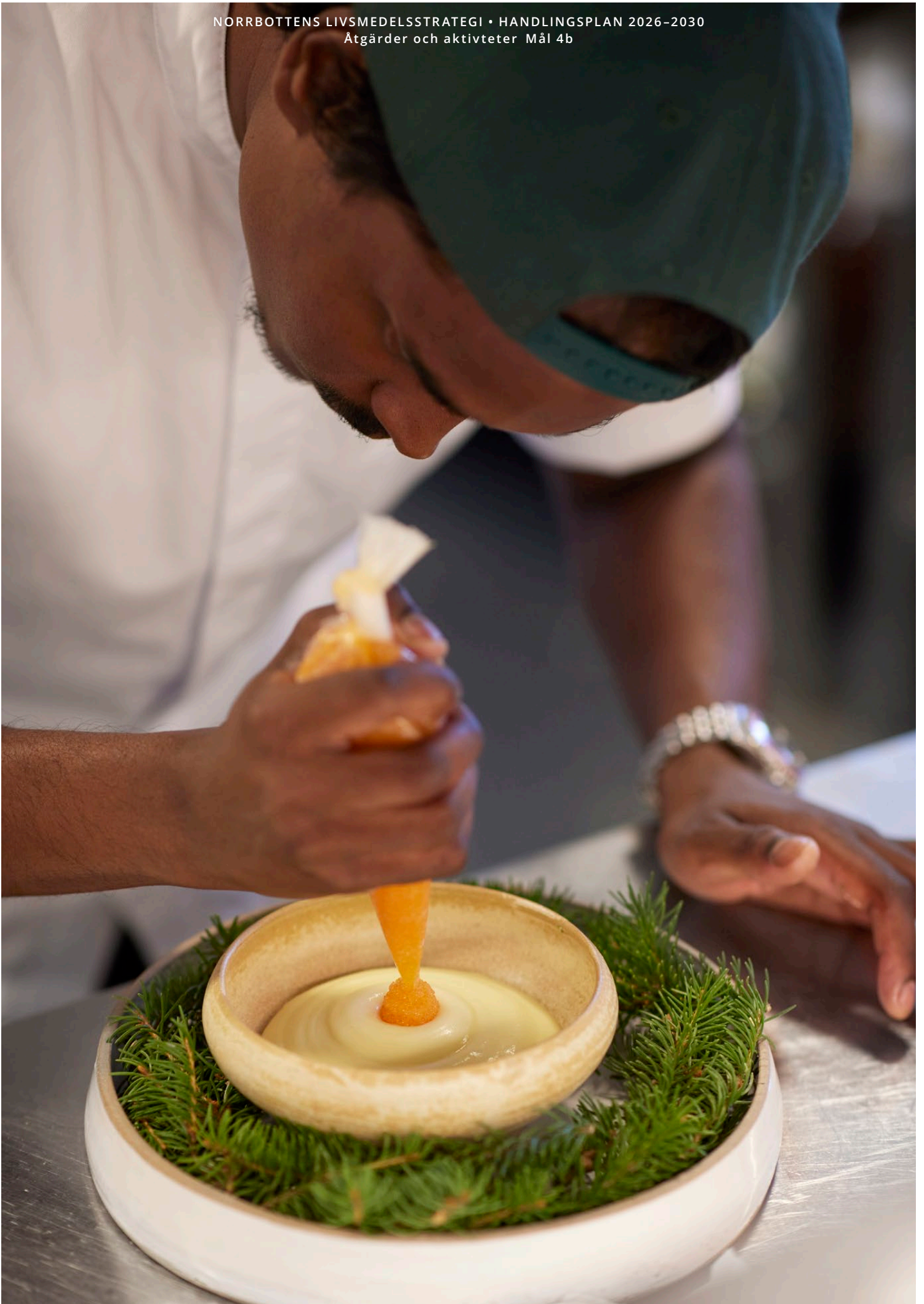
Förberedelse av norrbottnisk måltid på Arctic Bath, med fokus på lokala råvaror och hög gastronomisk kvalitet.