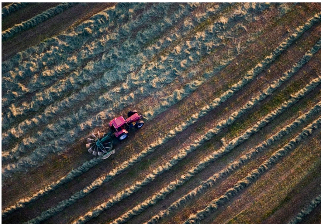
Skördetröska under arbete.

Målet är att produktionen av norrbottnisk mat ses som en viktig strategisk fråga och prioriteras av samhället.