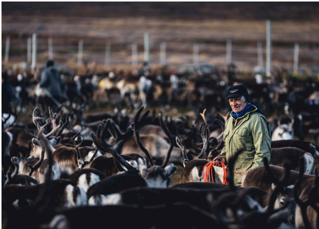
Kalvmärkning under sarvslakt, Guorbak, Sirges sameby.

✓ Genomförare: Forskningsaktörer, främjar- och rådgivningsorganisationer, livsmedelsföretag.