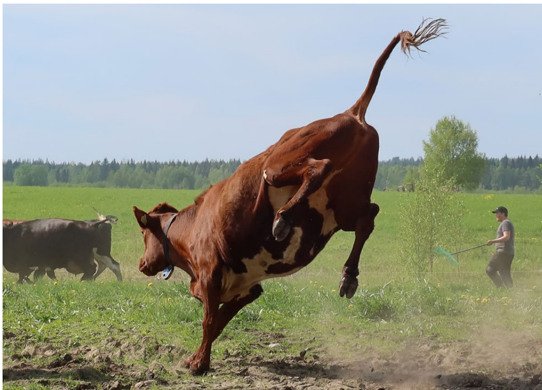
Ystra kor hos Pesulas lantbruk i Övre Kukkola.

Målet är att öka kunskapen om norrbottnisk produktion, dess mervärden och hälsosamma matval genom norrbottnisk mat.