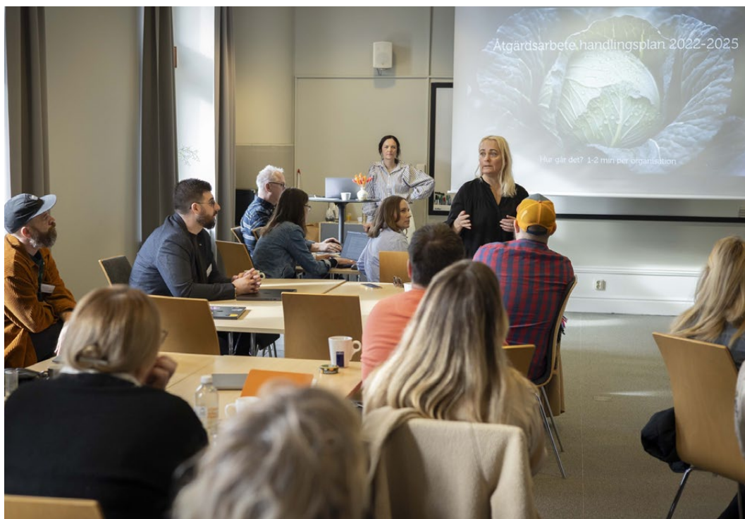
Workshop om utveckling av handlingsplan 2026–2030, med aktörer från hela livsmedelskedjan.

Alla synpunkter som har tagits emot har bearbetats och ligger till grund för Nära Mats handlingsplan 2026–2030.