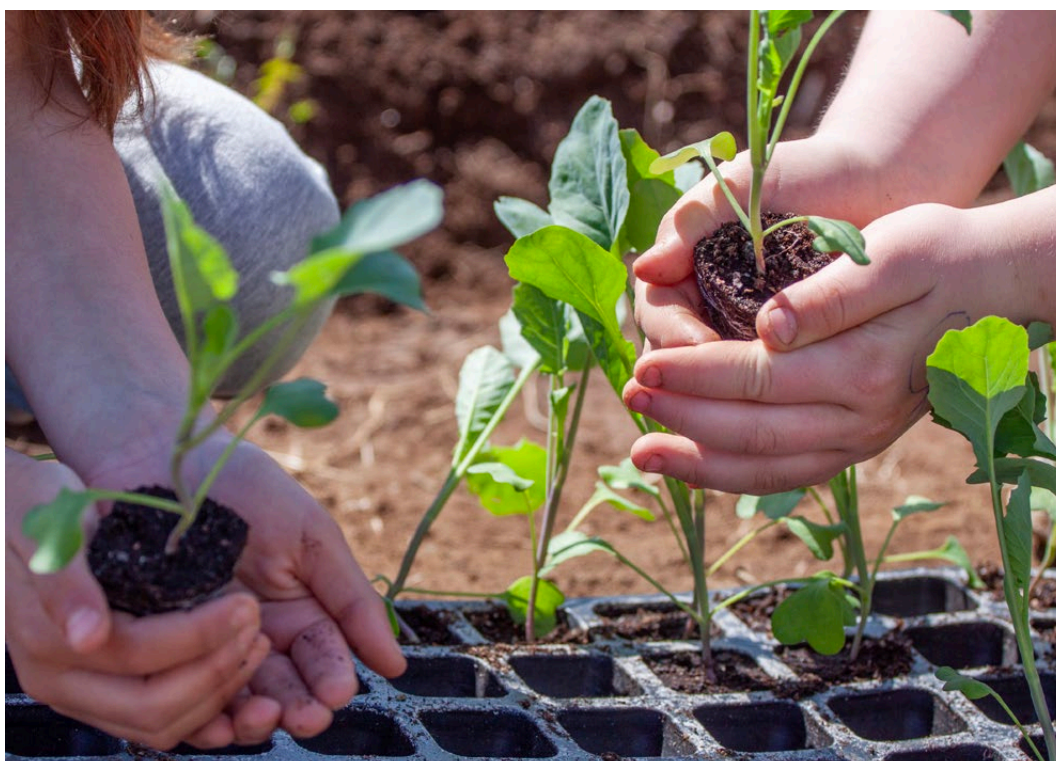
Varsamma barnhänder planterar förgroddade kålplantor.

☑ Genomförare: Nära Mat, Regionen, kommuner, främjar- besöksnärliga- och rådgivningsorganisationer.