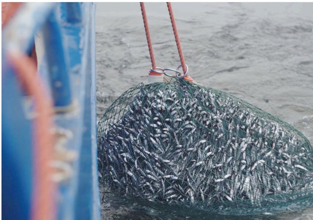
Trålning av siklöja i Bottenviken. FOTO: Guldhaven.